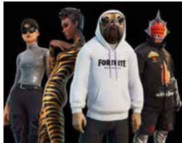
Fortnite-persónur í tiskufatnaði frá Balenciaga.