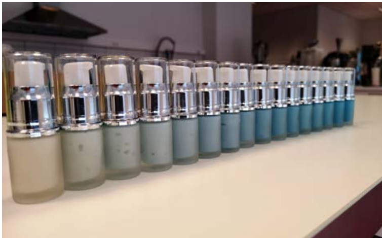
ICEBLU húðvörurnar frá TARAMAR byggja á lífvirkni bláa phycocyanine-efnisins.

Rannsóknir okkar á þanginu hafa leitt í ljós ótrúlega skemmtilega hluti. Þannig höfum við þróað efni úr þörungum sem vinna með stoðkerfi húðarinnar og geta jafnvel stoppað niðurbrot á efnum eins og kollagen, elastin og tyrosine, sem eru helstu byggingarefni húðarinnar. Einnig sjáum við hvernig efni úr þörungum örva frumurnar til að draga úr bólgu og stoppa oxun. Allir þessi þættir mýkja og græða húðina og aðstoð hana við að losa sig við úrgangsefni. Nýjustu vörurnar okkar sem