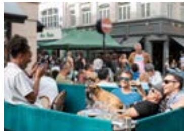
Pöbballífið er vaknað í London.