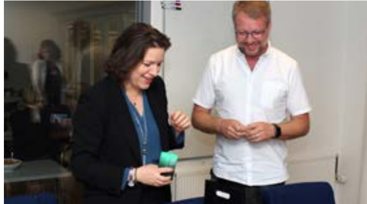
Viðar Garðarsson með Elizu Reid, forsetafrú Íslands.

Augnkremið Day Treatment frá Tamar endurræsir húðina og dregur fljótt úr baugum og augnfellingum.