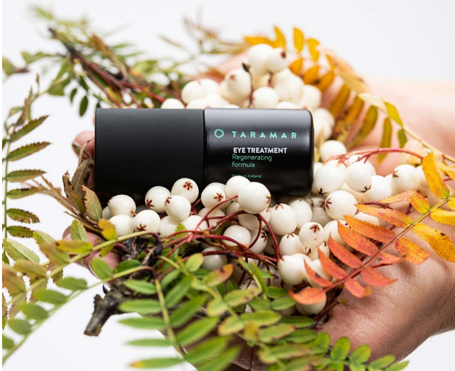
Augnkremið byggir á lífvirkni þangs og alparósar sem þéttir húðina og dregur úr fellingum þar sem húðin er farin að síga.

TARAMAR vörurnar byggja á langtíma rannsóknunum á lífvirkum innihaldsefnum, bæði fyrir matvæli og húðvörur. „Þannig hefur þróunin á TARAMAR vörunum nýtt sér rannsóknandiurstöður úr matvælarannsóknunum við Háskóla Íslands á fæðubótarefnum og lífvirkum efnunum úr náttúru Íslands, s.s. omega olíum og kitíni og þá sérstaklega rannsóknir er snúa að